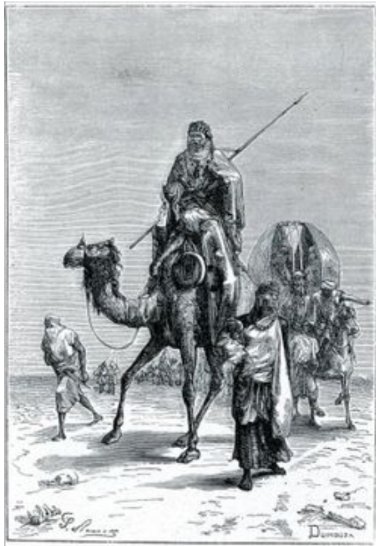
Benjamín de Tudela

En Constantinopla observa mercaderes de Asia y Europa, el esplendor de Santa Sofía, donde oficia un Papa " que no se lleva bien con el Papa de Roma "; ve en el Hipódromo las peleas de gallos, leones, leopardos y osos. Cuando observa el palacio de Blaquerna queda deslumbrado por sus riquezas. Percibió que los judíos bizantinos eran discriminados y no podían montar a caballo, excepto Salomón Hamistri, médico del Basileo.